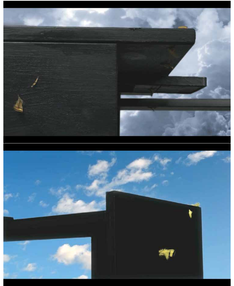
Endemisms , 2017. Stills da video. Video HD, 3'27"