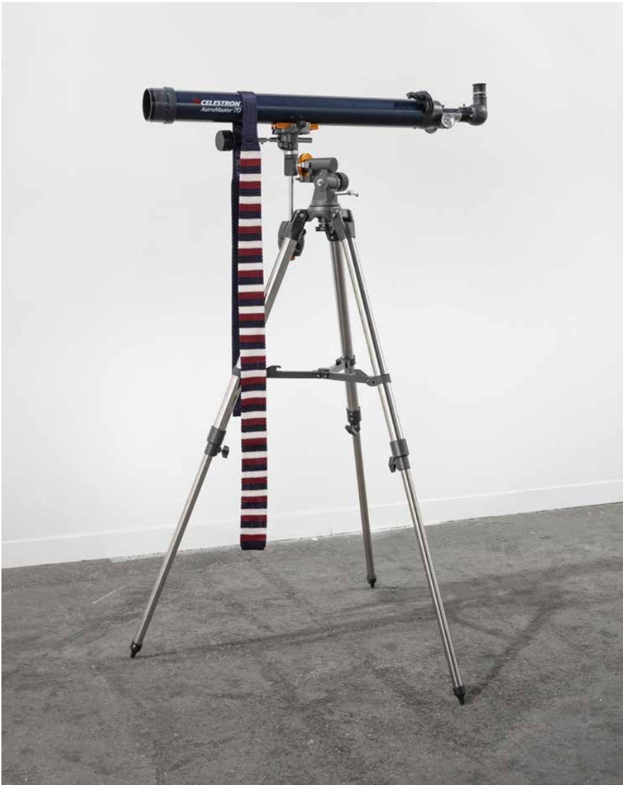
Alba , 2020. Telescopio, cravatta lavorata a maglia. 158 × 95 × 72 cm.