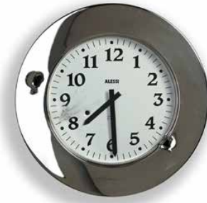
Shoot Me, Don't Criticize , 2014. Orologio di Aldo Rossi e fori di proiettile. 40 x 40 x 6,5 cm.

Nella personale del 2016 alla galleria parigina Bugada & Cargnel, "Everyone Stands Alone at the Heart of the World, Pierced by a Ray of Sunlight, and Suddenly It's Evening" – un titolo programmatico, che riprende i versi di Ed è subito sera di Salvatore Quasimodo e si pone come una sorta di protocollo dell'esposizione – il centro della scena è occupato da un'enigmatica figura seduta, The Thinker (2016), con la faccia allungata e le mani poggiate sul viso, illuminata da due faretto