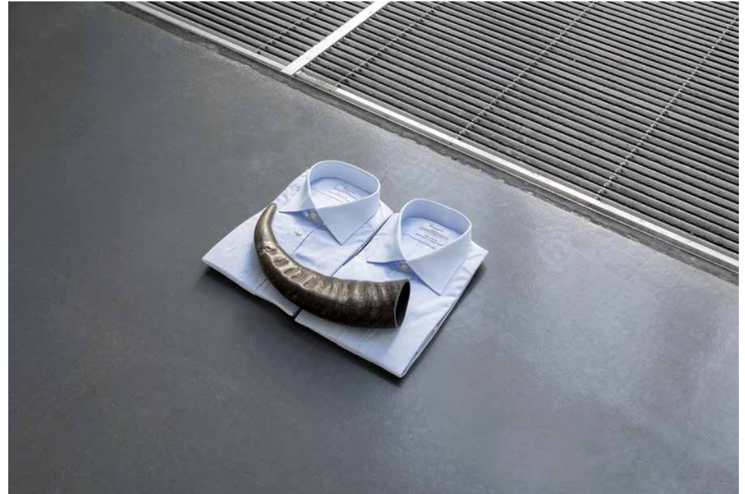
CENTAURE , 2019. Corno, camicie formali blu. 45 × 31,5 × 8 cm.