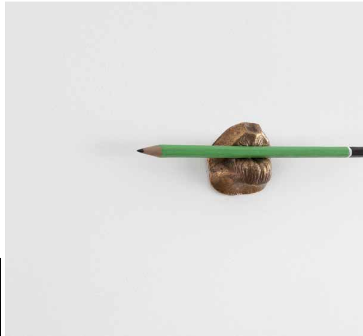
Bocca con Matita , 2020. Fusione in bronzo, vernice. 17 x 5 x 3,5 cm.