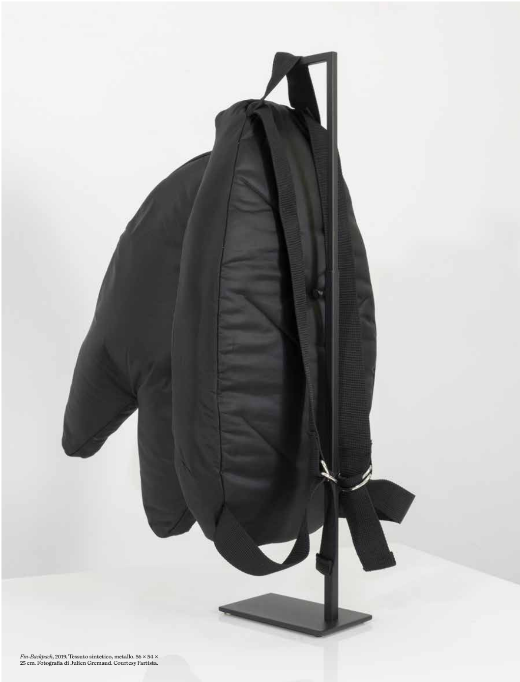
Fin-Backpack , 2019. Tessuto sintetico, metallo, 56 x 54 x 25 cm.