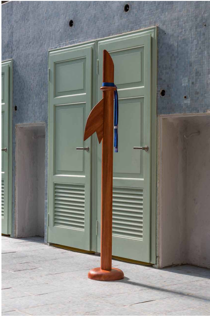
Claire , 2019. Poliuretano, fibra di vetro, resina acrilica, pittura a olio, cravatta lavorata a maglia. 175 × 27 × 27 cm.